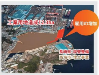
●大島地区工業団地整備事業 (R4 完成目標)