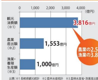
●長崎県の各産業比較 (H27)