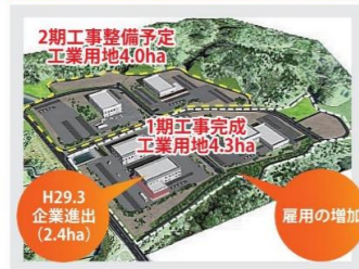
●パールテクノ/西海 2期工事整備予定