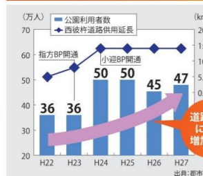
●西海橋公園の利用者数と西彼杵道路の供用延長