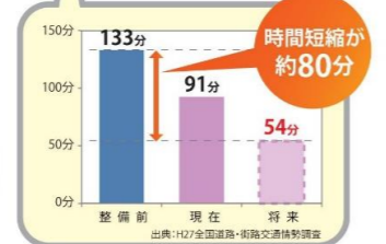
●長崎市～佐世保市間の所要時間 (西海市経由)