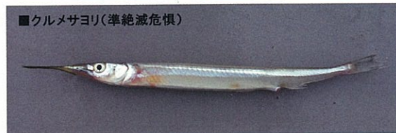
■クルマサヨリ(準絶滅危惧)