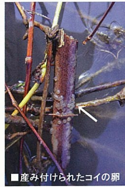
■産み付けられたコイの卵