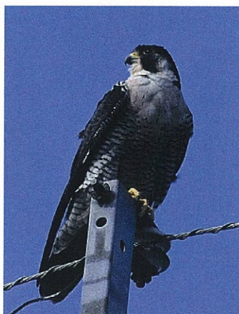
■ ハヤブサ(絶滅危惧Ⅱ類)