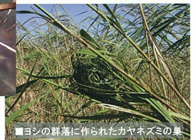
■ヨシの群落に作られたカヤネズミの巣