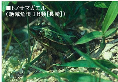
■トノサマガエル (絶滅危惧 I B類 [長崎])

また、水際部分にはトンボ類、ユスリカ類、ハエ類などの昆虫類が飛来するため、これらを狙うトノサマガエルやニホンアカガエルなどの多くの両生類が生息しています。