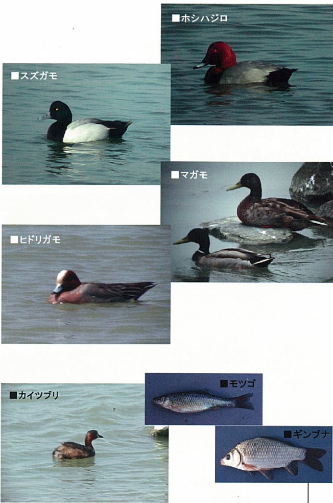
■ 調整池に生息する魚がカイツブリ類の餌となる

調整池の広大で静穏な水域は、海ガモ類や陸ガモ類が大きな群れで休息するのに適した環境です。水域では、冬になるとホシハジロ、スズガモ、マガモ、ヒドリガモなどのカモ類が数千羽の大群で越冬しています。