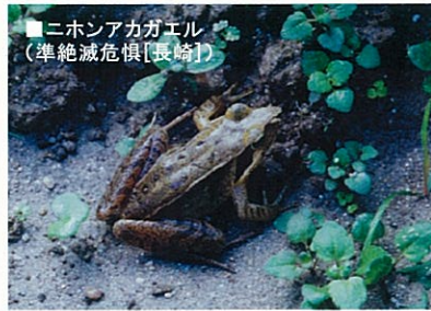
■ニホンアカガエル (準絶滅危惧 [長崎])