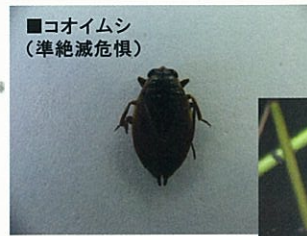
■コオイムシ (準絶滅危惧)