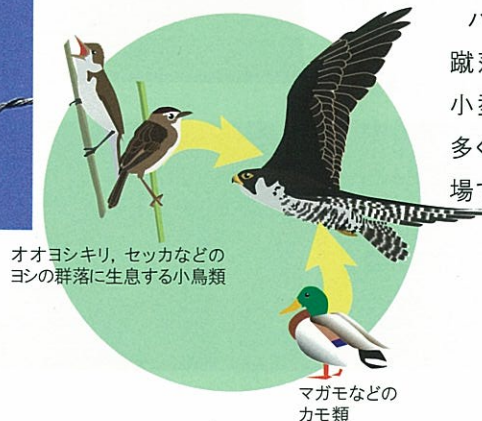
オオヨシキリ、セッカなどのヨシの群落に生息する小鳥類

ハヤブサは、飛んでいる鳥を上空から急降下して足で蹴落として捕らえる、というダイナミックな狩りをします。小型～中型の鳥類を主な餌とするハヤブサにとって、多くの水鳥類や小鳥類が集まる調整池は絶好の狩りの場です。