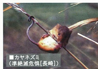
■カヤネズミ (準絶滅危惧 [長崎])