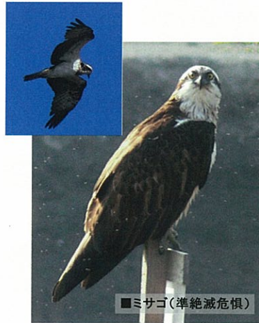
■ ミサゴ(準絶滅危惧)

水域では、魚を狙って魚食性の猛禽類であるミサゴが飛来します。水面をゆっくりと飛び回り、魚を見つけると、素早く翼を羽ばたかせて空中に静止(ホバリング)した後に急降下して、脚を伸ばして両足で魚を捕まえます。