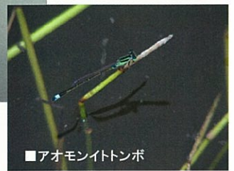
■アオモンイトトンボ