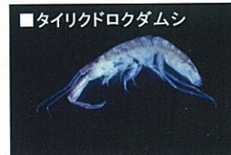
■タイリクドロクダムシ