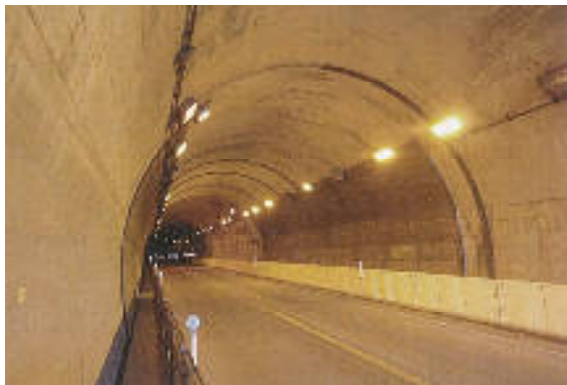
〈一般国道202号長崎市京泊(京泊トンネル)〉

長崎県においては、平成26年度までに比較的大きな損傷については補修を完了しており、現在は規模の小さな段階で効果的な補修を実施しています。 また、法定化された定期点検により、トンネルの状態を的確に把握し、適切な維持管理を行っています。