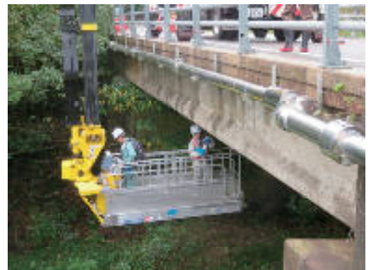
橋梁の定期点検状況

長崎県では、不具合が生じてからの補修ではなく、「 予防保全的手法 」を導入した効率的かつ計画的な維持補修を行うための維持管理計画を策定し、施設の延命化とライフサイクルコストの縮減を図り、次世代に社会資本を引き継ぎます。