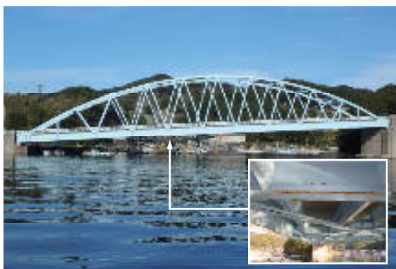
〈主要地方道佐々鹿町江迎線 佐世保市小佐々町 楠泊橋〉

長崎県においては、早期に補修が必要な21橋について平成29年度までに対策を完了し、平成30年度から損傷規模の小さな段階で効果的な補修を実施しています。 また、法定化された定期点検により、橋梁の状態を的確に把握し、適切な維持管理を行っています。