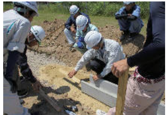
～土木施工管理基礎研修の様子～