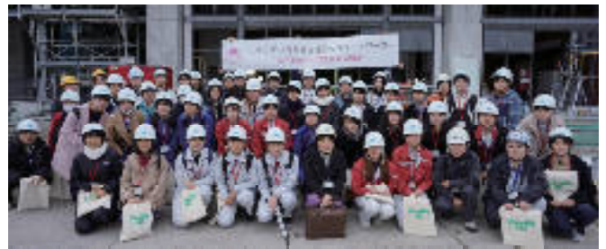
“よりより”～ながさき建設女子ネットワーク～ 女子高校・大学生合同交流会