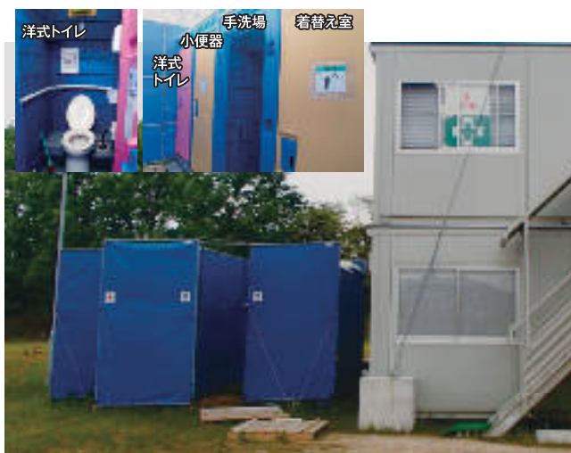
～「快適トイレ」の一例～