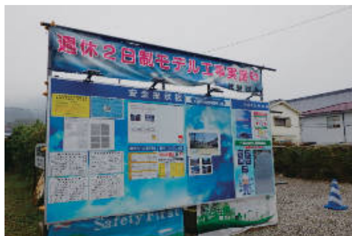
～「週休2日」取組の掲示状況～