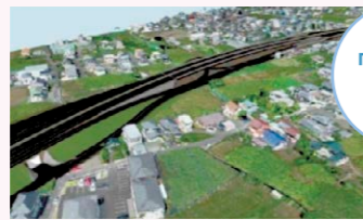
誰もが簡単に図面を理解