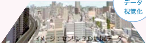
イメージ：センリン3D地区データ