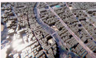
中島川周辺三次元図