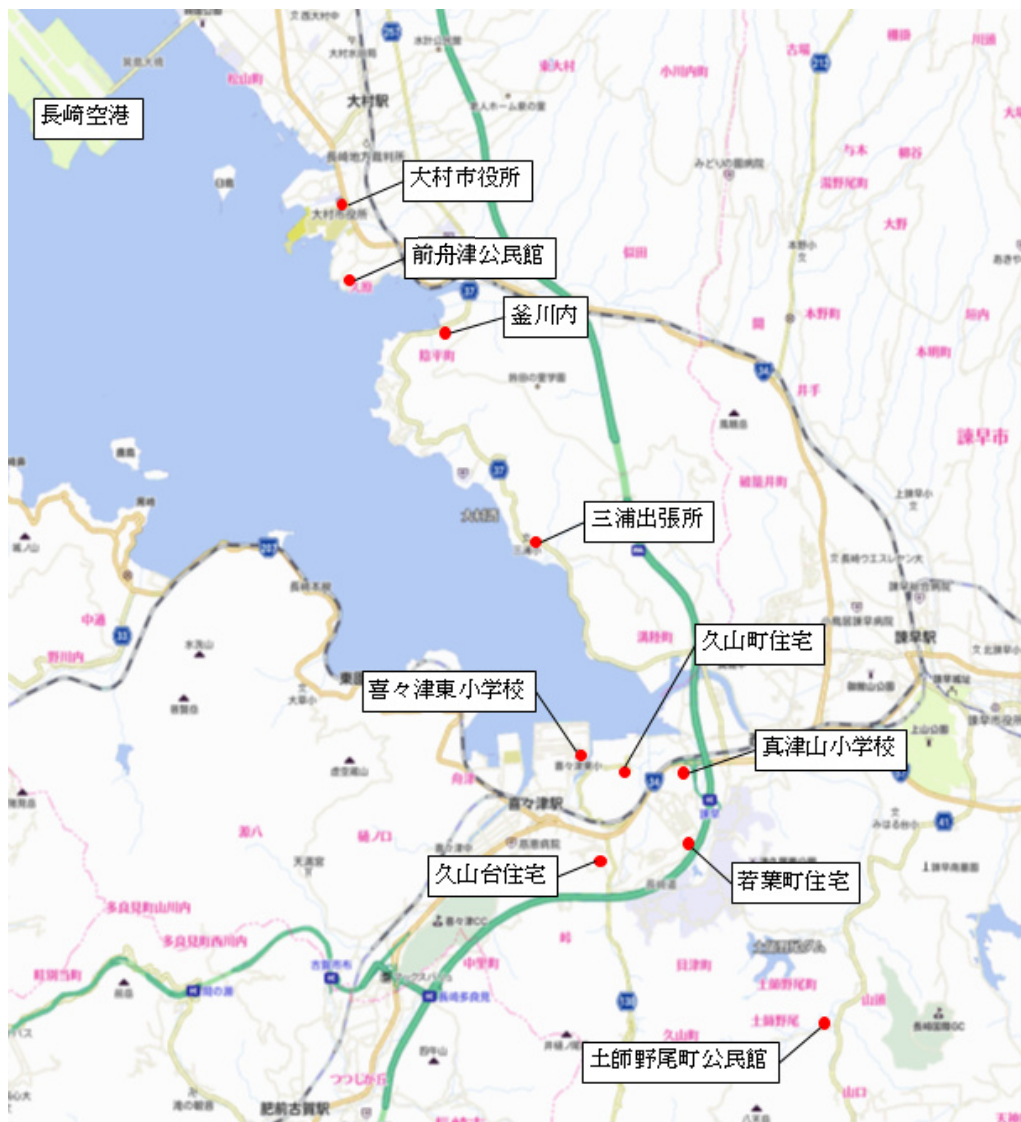
図3-3 長崎空港周辺の騒音測定地点