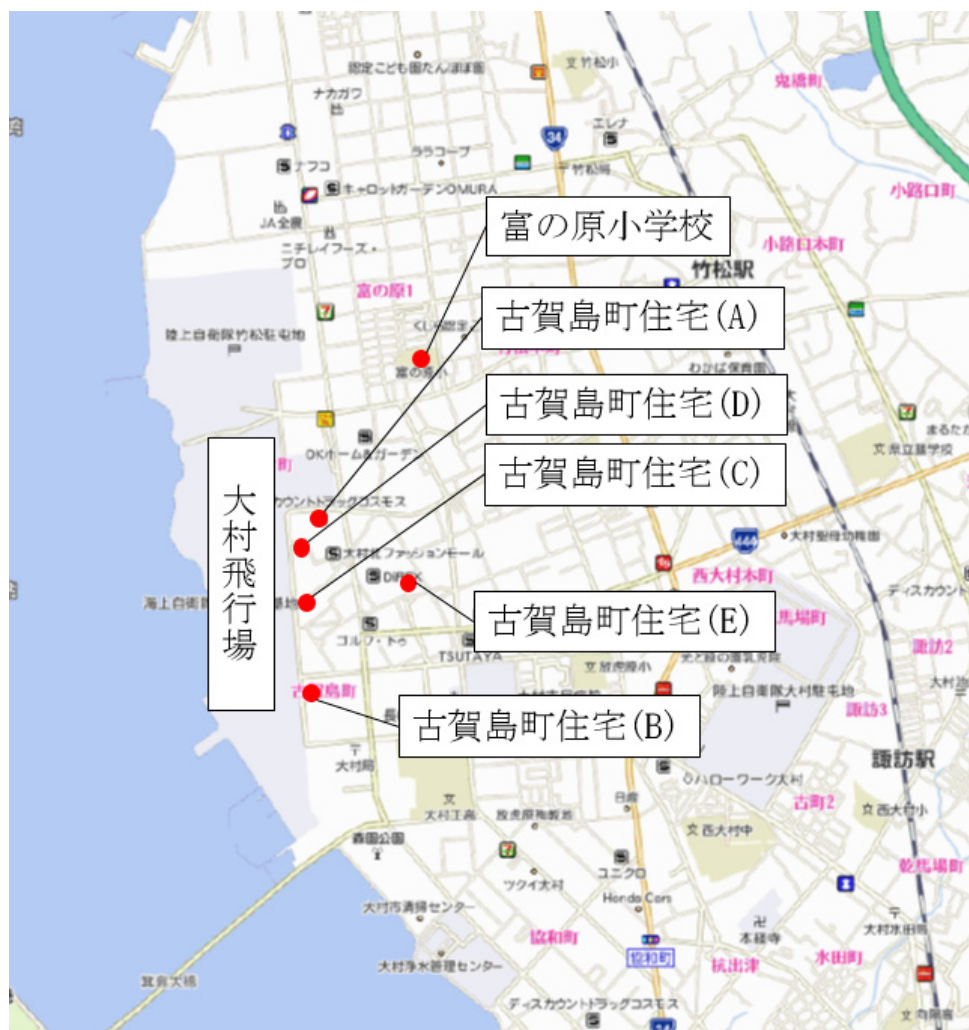
図3-4 大村飛行場周辺の騒音測定地点