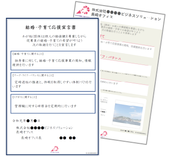
1 宣言書・チラシのイメージ