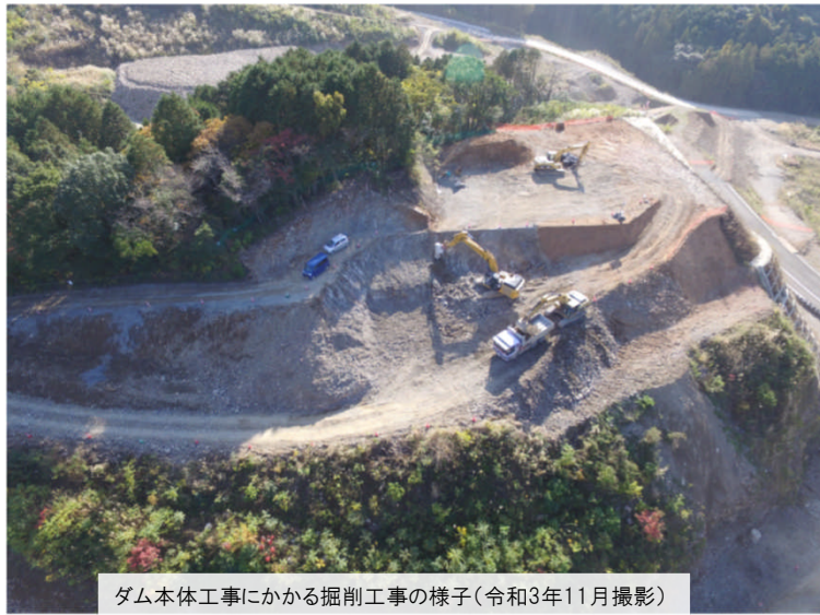
ダム本体工事にかかる掘削工事の様子(令和3年11月撮影)

昨年9月8日、石木ダム建設予定場所の掘削を開始し、ダム本体工事に着手しました。 また、付替県道工事についても、新たに橋梁工事に着手するなど工事進捗に努めています。