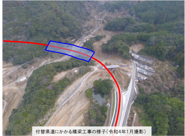
付替県道にかかる橋梁工事の様子(令和4年1月撮影)