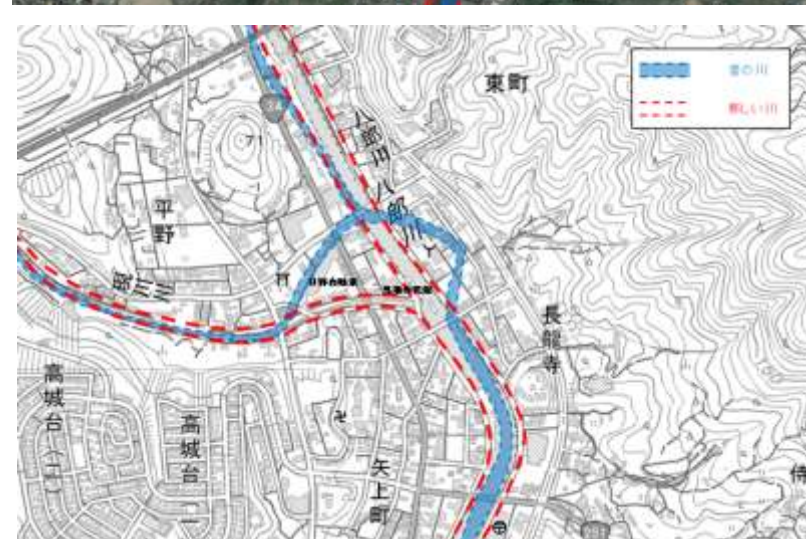
(八郎川、現川合流点付近の航空写真と地図)