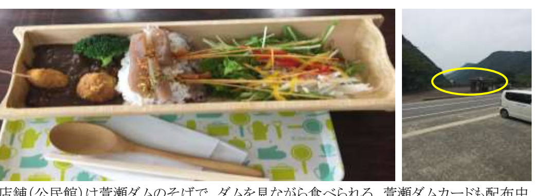
店舗（公民館）は萱瀬ダムのそばで、ダムを見ながら食べられる。萱瀬ダムカードも配布中。

【販売終了】本河内ダムカレー（長崎市 県庁レストラン「シェ・デジマ」） 平成29年に、本河内高部ダム・本河内低部ダムが国の重要文化財に指定されたことを受け、これまで2度、期間限定で提供された。今後の復活はあるか。