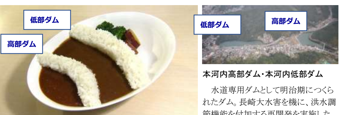
本河内高部ダム・本河内低部ダム 水道専用ダムとして明治期につくられたダム。長崎大水害を機に、洪水調節機能を付加する再開発を実施した。