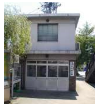
(左上写真：トイレ・大気観測施設、右上写真：交番) 交差点の改良にあたり、これらの施設の移設を行いました。