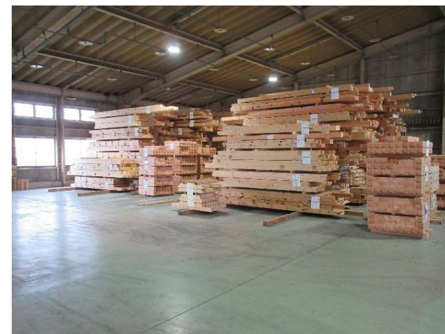
地域材を活用した木造住宅のプレカット加工の状況