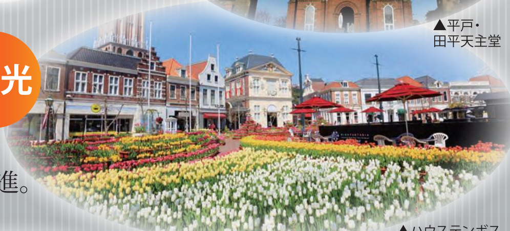
▲ハウステンボス