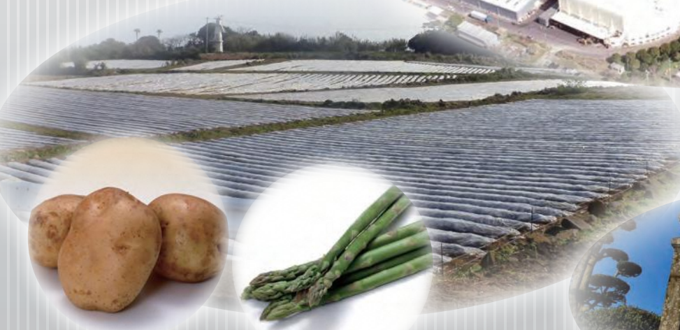
▲松浦・農業関連企業の進出