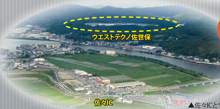
▲佐々ICとウエストテクノ佐世保

企業誘致 Enterprise invitation アジアへの近さ、少ない災害リスクを武器に、企業が次々と進出。