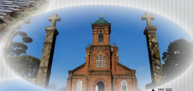
▲平戸・田平天主堂