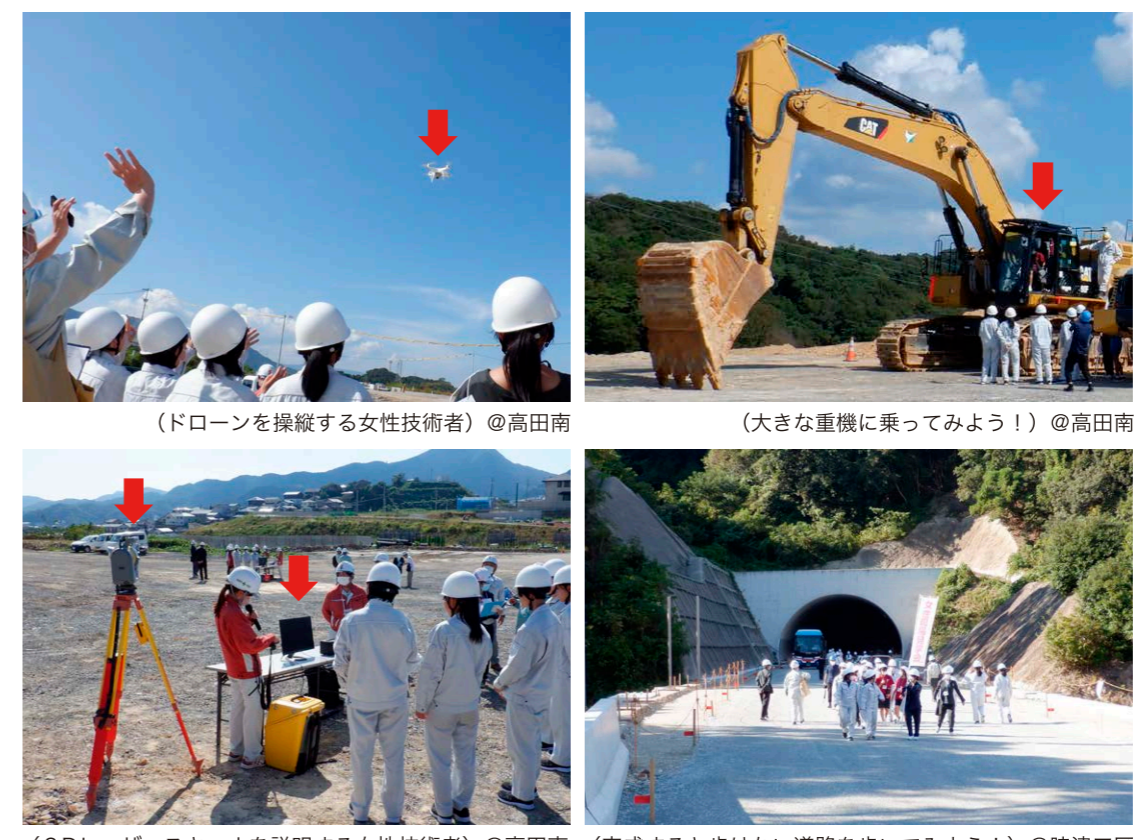
(ドローンを操縦する女性技術者) @高田南

日時:令和4年10月1日(日) 場所:西彼杵郡長与町高田郷の高田南宅地整備事業及び時津町野田郷の西彼杵道路(時津工区)の道路改良工事現場