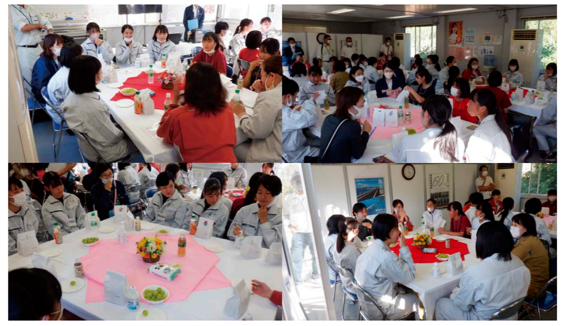
(あっという間だった女性技術者とのトークタイム!) @時津工区

女子高校生27名と女性技術者12名(県職員・建設業者・設計コンサルタント)が参加し、女性技術者の活躍紹介や重機試乗・ドローン等の体験、普段見ることのできない道路建設現場の見学、女性技術者とのトークタイムを行いました。