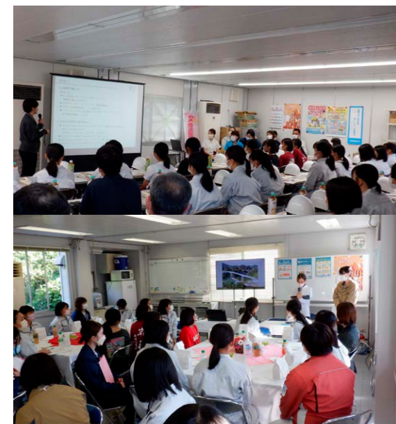
(女性技術者の活躍紹介～仕事内容などの発表)