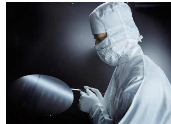
最高水準の環境下で製造されるシリコンウェーハ(半導体の材料)

世界的な需要拡大が見込まれる半導体・航空機関連企業やIT企業などの立地が増えています。