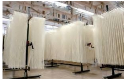
うどん乾燥施設の拡張