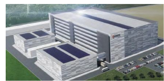
長崎諫早工場(仮称)完成予想図