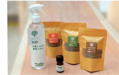
精油100%の「対馬ひのきエッセンシャルオイル」と対馬ひのきの除菌スプレー、対馬の木でつくった燻製チップ