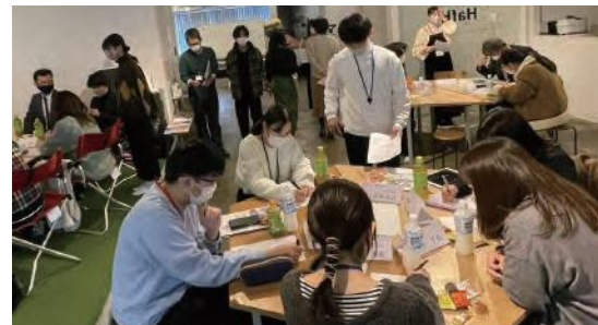
令和4年12月開催 就活お茶会

※長崎大学の現役大学生で構成された団体。学生による学生のための就活支援を行っている