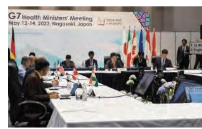
大臣会合セッションの様子

また、本県として会合を機に発出した「ながさき健康宣言」を踏まえながら、県民の皆さんがいつまでも健康で活躍できる社会の実現に向けた取り組みも促進していきます。