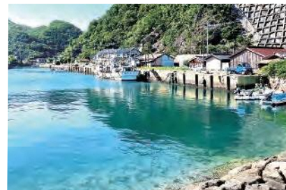
昔ながらの対馬の風景が残る千尋藻集落

昔から食べることに、特にお菓子が好きで、高校卒業後は福岡の製菓専門学校へ進みました。その後、徳島のケーキ店に就職しましたが、働いているうちに、ケーキ作りよりも経営の方に意識が向くようになり、いつか自分で起業したいと思うようになり、フランスへの短期留学をはじめ、海外や国内、いろんなまちを旅する中で、対馬の美しい自然、素朴な街並み、独特の伝統や文化、人々の優しさなど、対馬の良さを改めて実感し、せっかくなら、大好きなふるさと対馬で頑張ろうと、2020年にUターン。今年3月まで島おこし協働隊として、地元住民とのご当地スィーツの開発や地区のコミュニティ活動、鳥獣対策、移住・定住促進などに取り組み、現在も各方面で地域へのサポートを続けています。