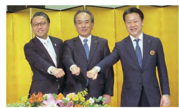
立地協定調印式の様子

県では、新工場の円滑な稼働開始に向けて、諫早市とも連携しながら、人材確保・育成やインフラ整備、県内企業との連携、住居・通勤対策などの総合的な支援に取り組んでいきます。