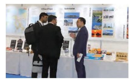
大石知事から参加者へ本県の魅力をアピール

問合せ G7長崎保健大臣会合推進協議会 ☎095-895-2091 G7長崎 検索