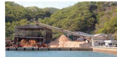
浅茅湾の仁位港近くに建つ社屋と工場(対馬市豊玉町)

対馬の人工林の低質材を有効利用するため、平成22年に父がチップ製造を行う本組合を設立しました。私はUターン後、平成26年から後継者として運営に携わり、今年の春に代表理事に就任。本組合は、木材チップの生産量が対馬全体の94%を占め、対馬の木材生産量増大に寄与したことや、ヒノキ精油を活用した商品の開発・販売により、森林・林業の新たな価値の創出に尽力したことが評価され、令和4年度ながさき農林業大賞県知事賞を受賞しました。