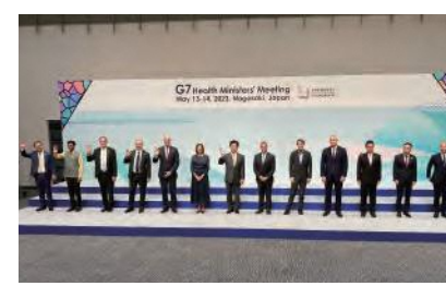
大臣主催レセプションでの集合写真