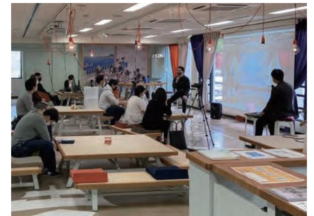
CO-DEJIMAでのスタートアップイベントの様子

長崎でチャレンジしたい方を応援するスタートアップ支援などの環境づくりが進んでいます。