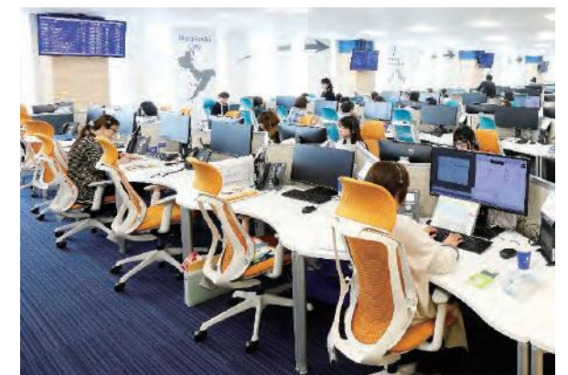
明るく開放的なオフィス