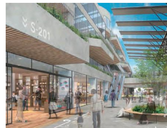
長崎スタジアムシティ内の商業施設 ※構想段階のため今後変更になる可能性があります

大型商業施設の建設やオフィスビルの開業により新たな雇用の場の増加が期待されています。