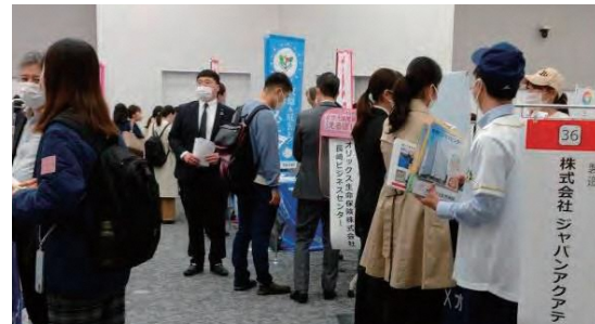
令和4年11月開催 長崎しごとみらい博

対面での説明会やオンラインでのセミナーを実施しており、学生は長崎の企業を知ることができ、企業は自社の魅力を伝えることができる良い機会となっています。オンラインでは県外の学生も気軽に参加することができるほか、説明を聞きながらチャットで質問することもできます。