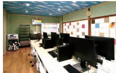
古民家を改修したサテライトオフィスの開設