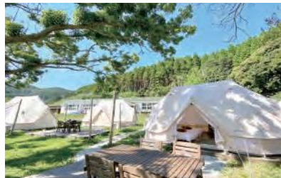
廃校舎を利用したグランピング