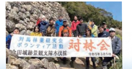
景観を保つために木を伐採するボランティア活動なども行っている

現在、従業員は15名で、私が帰島した当時と比べると雇用も売り上げも約2.5倍になりました。今後さらに売上を伸ばして雇用を増やし、対馬の人口流出に少しでも歯止めをかけたいと思っています。また、今年度から対馬の木材業者38社が加盟する対馬木材業組合の組合長にも就任しました。木材業界も高齢化が進んでいるため、若い人たちの仕事へのモチベーションを上げ、対馬で林業をやってよかったと思ってもらえるように、研修会や交流会を通して親睦を深めています。