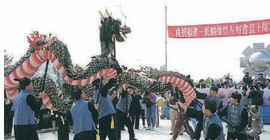
龍踊りの中国里帰り披露