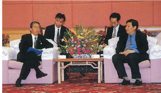
習近平福建省長代行との会談