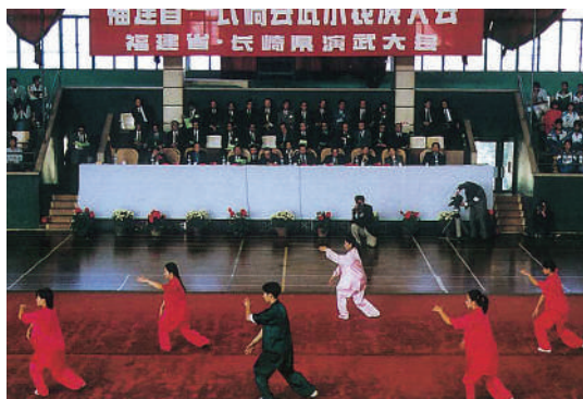
日中交流武術演武大会