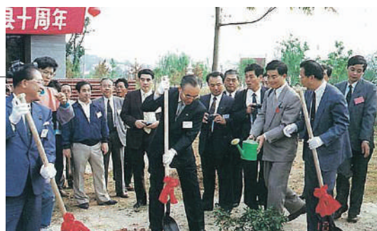
福州市左海公園で平戸つつじを記念植樹

日中国交正常化20周年、並びに長崎県・福建省友好県省締結10周年を記念し、福建省との一層の交流拡大と友好関係の充実・強化を図るため、高田知事を団長に、県議会並びに市町村及び関係団体等の参加を得て総勢163名の訪問団を派遣しました。福建省政府要人との意見交換をはじめ、記念植樹式や龍踊りの中国里帰り、福州大劇院で「記念の夕べ」を開催するなど、様々な記念事業を実施しました。