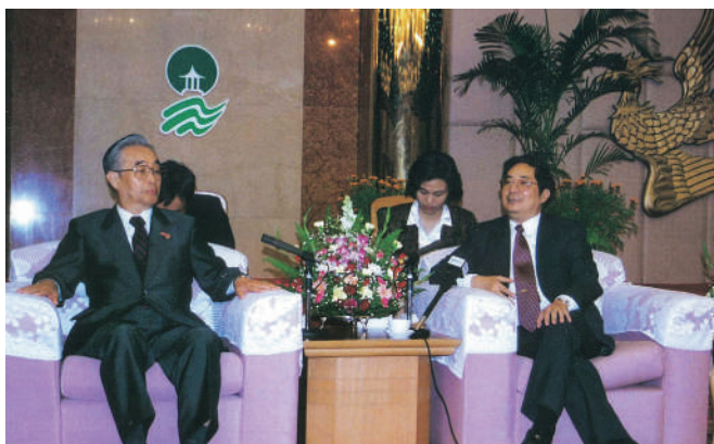
陳明義福建省党書記との会談