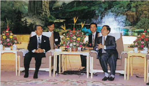
陳明義福建省党委書記との会談