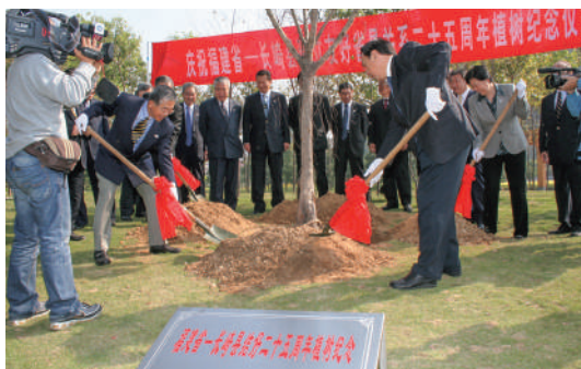
ガジュマルの記念植樹