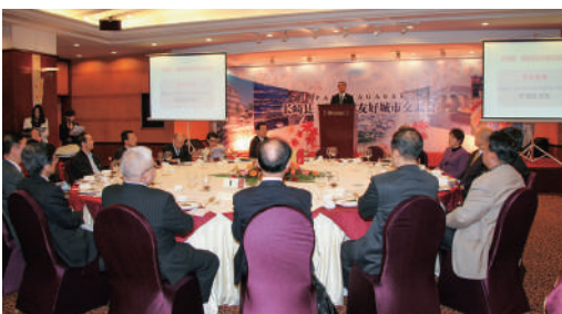
長崎県・福建省友好都市交流会