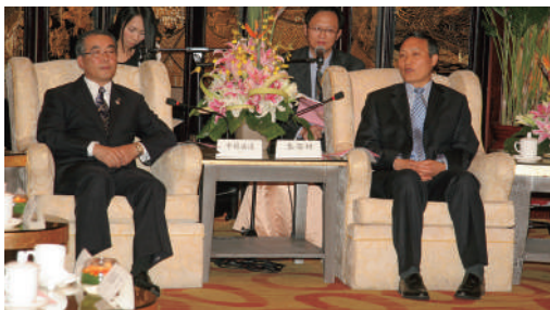
袁荣祥福州市書記との会談