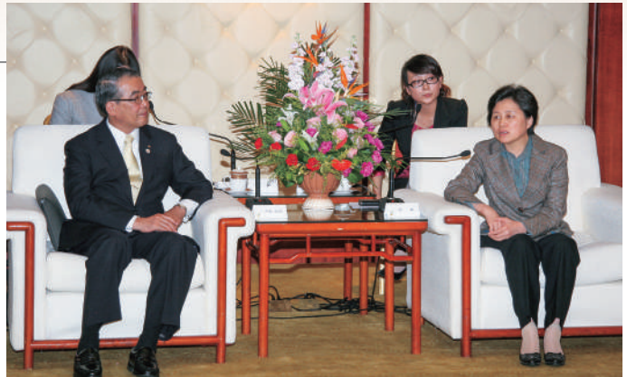
陳樺福建省副省長との会談

本県と福建省との友好交流をさらに深めるため、中村知事を団長に、県、県議会、経済団体、各市町、華僑関係者からなる訪問団を派遣しました。長崎歴史文化博物館と福建博物院による交流協定を締結したほか、将来の国際定期便開設に向けた国際チャーター便の誘致活動や本県観光のPRを行うとともに、将来に向けた幅広い交流促進について、意見交換を行いました。