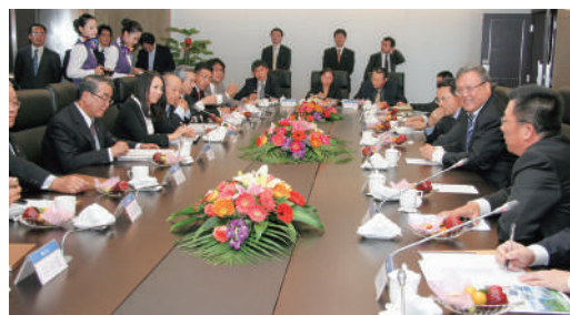
洪荻生廈門航空董事長との会談