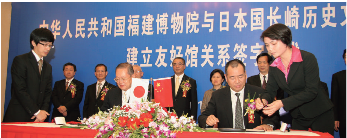
福建博物院と友好交流協定を締結