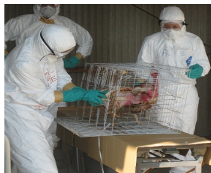
防疫演習(捕鳥作業)