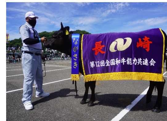
第12回全国和牛能力共進会 (R4年) 長崎県代表牛選考会