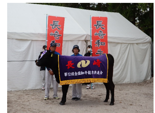
第12回全共 第3区「かの」号 優等賞8席