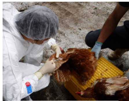
鳥インフルエンザ モニタリング検査

口蹄疫や高病原性鳥インフルエンザ、またその他の家畜伝染病の発生予防のため、飼養管理基準の遵守指導を徹底し、万一の発生時に被害を最小限に抑えるため、関係機関と連携した初動防疫態勢の強化に努める。