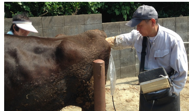
集合指導(妊娠鑑定)