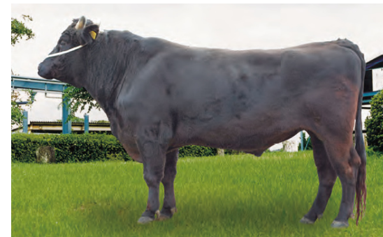
「金太郎3」号 H20年勝本町産

家畜改良増殖法に基づく種畜検査、家畜人工授精及び受精卵移植技術の技術普及、指導を行っています。また、肉用牛振興のため、種雄牛造成事業や全国和牛能力共進会等の取組みを支援しています。