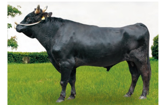
「弁慶3」号 H23年郷ノ浦町産