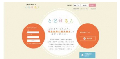
「とどけるん」のトップページ