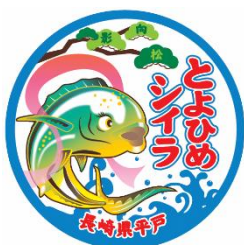
とよひめシイラ ロゴ