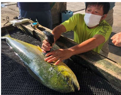
フィッシュアナライザによる脂肪量測定