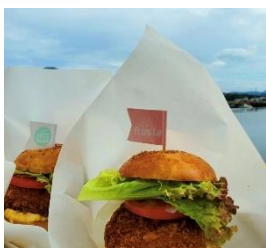
築地ボンマルシェ監修 シイラバーガー