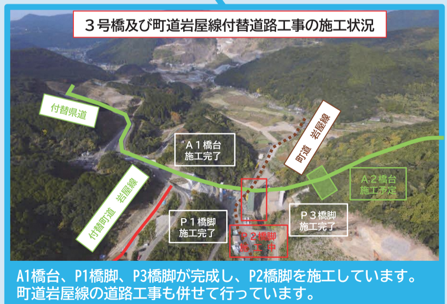
A1橋台、P1橋脚、P3橋脚が完成し、P2橋脚を施工しています。町道岩屋線の道路工事も併せて行っています。

「水のわ」に関して、ご質問やご意見等がありましたら、下記連絡先にお寄せください。