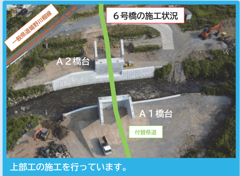
上部工の施工を行っています。