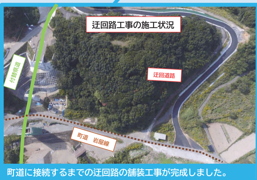
町道に接続するまでの迂回路の舗装工事が完成しました。