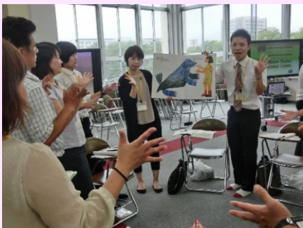
小学校外国語教育研修講座Ⅰ「絵本の指導と実演」の様子