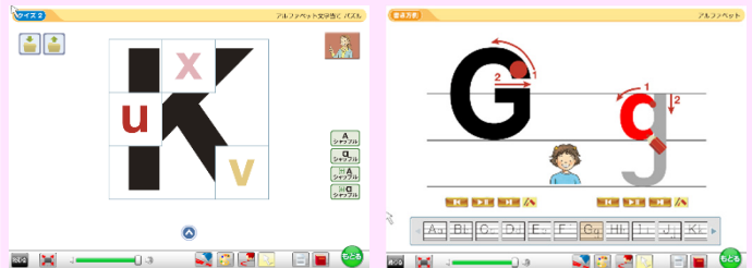
アルファベット文字を認識する力を高めるための教材例

映像や音声を活用して、「読む」「書く」の態度を含めたコミュニケーション能力の基礎を養うことができるよう作成された補助教材。以下の3点における指導で生かす。