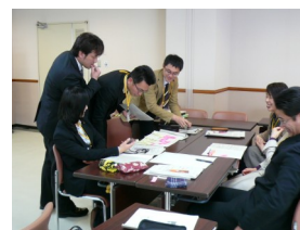
ワークショップ形式による演習の様子 (特別支援学校校内研究の推進研修講座)

今年度がまとめの年となります。「学習指導」や「生徒指導」「進路指導」における指導・支援に関する実践例を収集・整理し、効果的な指導・支援の在り方についてWebサイト「玖島の杜」にて公開します。