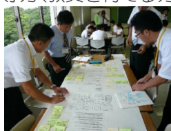
2年次受講者の研修風景

今後、各学校や各地区での活躍を通して、児童生徒の学力向上につながることを期待しています。