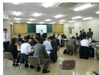
教育リーダー研の研修風景

学校において、学校経営に参画する意識を持った中堅教員を育成するための講座です。学校組織マネジメントに関する内容を理解するとともに、勤務校で具体的に実践していただきます。