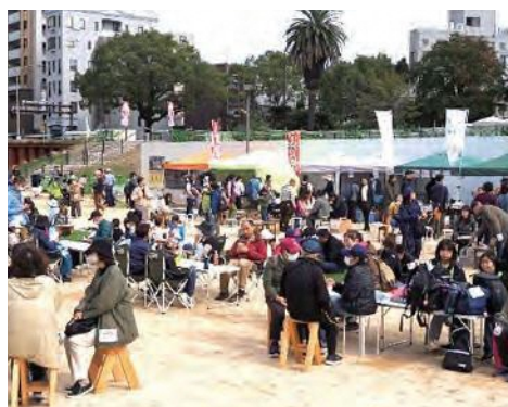
「#ナガサキアオゾラ市場」の様子