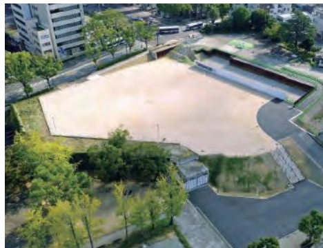
県庁舎跡地の全景

県では、県庁舎跡地の今後の整備に向けた検討を現在の利用状況などを検証しながら進めています。今後もさまざまなイベントの開催を予定していますので、ぜひ、県庁舎跡地にお立ち寄りください。