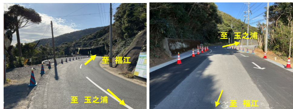
起点側 工事状況写真