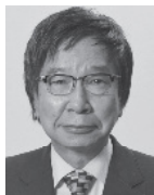
大門 みさし 1956年生まれ。 参議院議員4期、 党中央委員