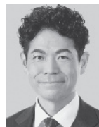
たけだ 良介 1979年生まれ。 参議院議員1期、 党中央委員