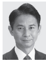
谷 あい 正明 現3 たに まさあき 元農林水産副大臣、党参議院幹事長、京都大学大学院修士課程修了。49歳。