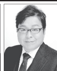
党首 桜井 誠