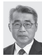
宮崎 まさる 現1 みやざき 前環境大臣政務官、党環境部会長、埼玉大学工学部卒、64歳。