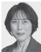
田村 智子 1965年生まれ。 党副委員長・ 政策委員長、 参議院議員2期