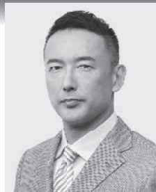
れいわ新選組 代表