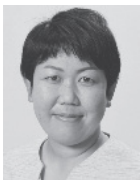
いわぶち 友 1976年生まれ。 参議院議員1期、 党中央委員