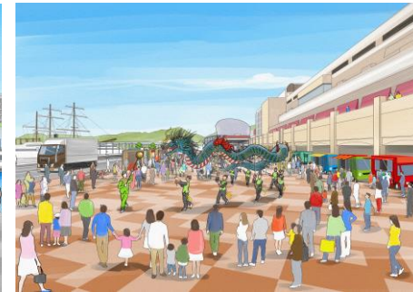
【にぎわい施設の内部】