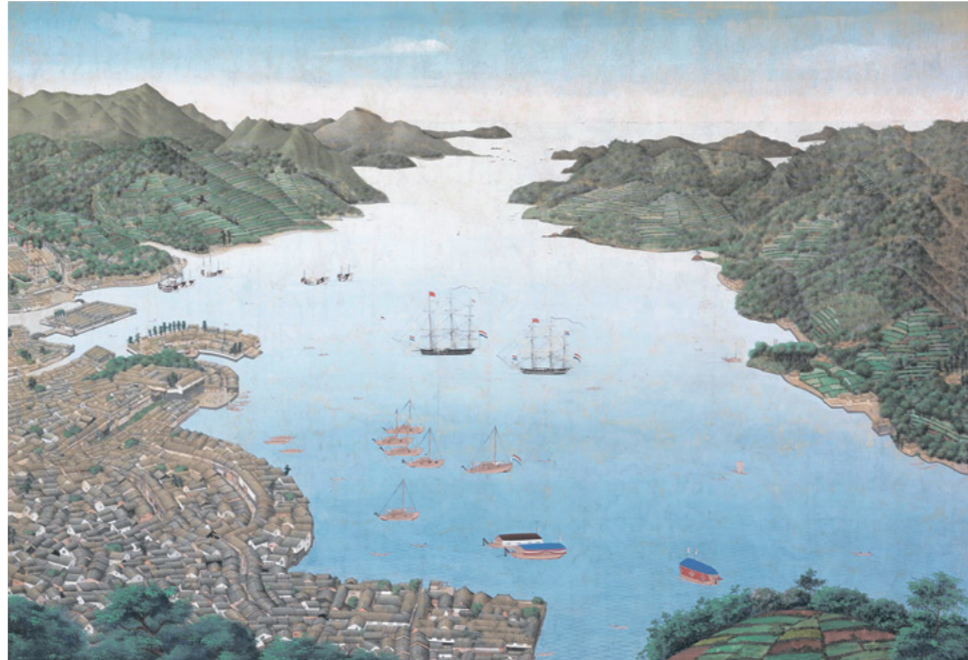
〔長崎港図〕

カーボンニュートラル実現に向けて、海洋エネルギー関連産業や半導体関連産業といった新しい時代に対応した産業を振興するとともに、未来を創る新たなサービスの創出や先端技術の社会実装を進め、離島や半島を多く有する本県の地域の活力へつなげていきます。