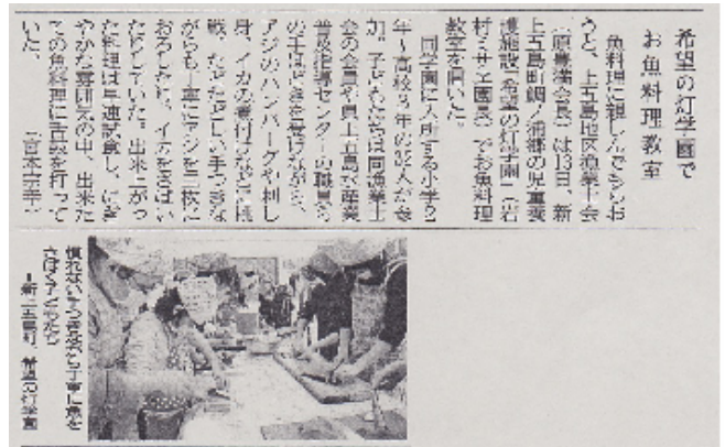
新聞にも掲載されました