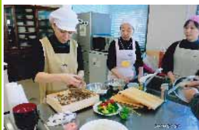
大村市保育会給食部会研修会