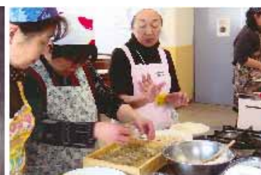
大村市福祉保健部国保けんこう課の講習会