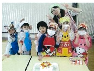
デコレーションケーキ