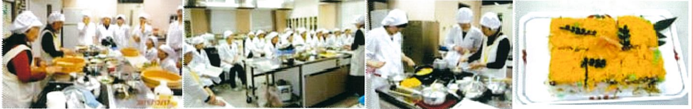
長崎県立大学シーボルト校での郷土料理伝承講習会の様子