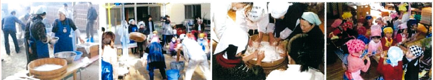
もちつき会の様子

平成24年1月、佐々町、さざなみ保育園の園児80名程度を対象にもちつき会を開催しました。毎年、旧正月に合わせてもちつき会を開催し、地域のボランティアとして5名参加しました。園児達も、もちをついたりまるめたり、小さい手で一生懸命、楽しく行いました。