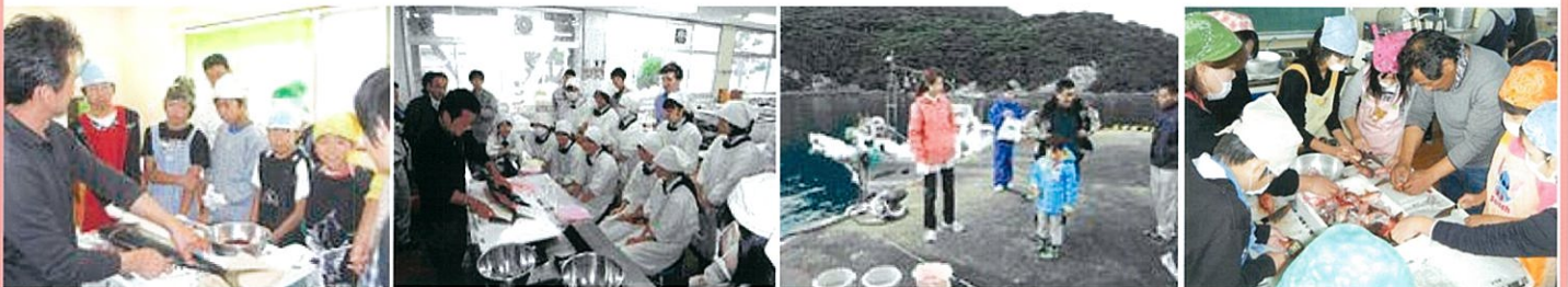
五島水産業普及指導センターによる魚のさばき方の体験と試食会(左・中)魚釣り大会(右)