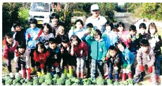
ブロッコリーの収穫