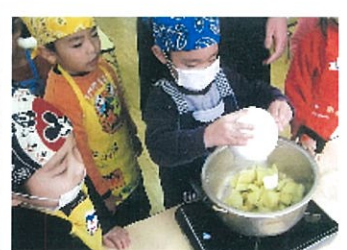
スイートポテト作り