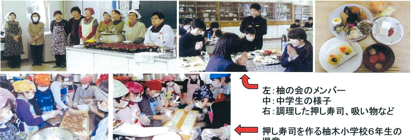
左: 柚の会のメンバー 中: 中学生の様子 右: 調理した押し寿司、吸い物など