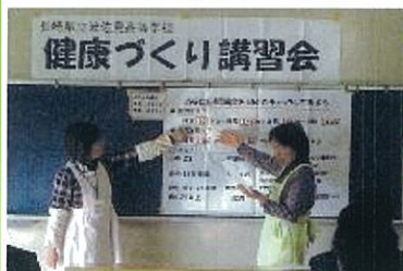
波佐見高校での健康講座と調理実習

1つ1つの作業は、丁寧かつ手早く行っていました。自分たちで作った料理を美味しいと食べていた表情が見れて良かったです。私たちも若いパワーをたくさんもらえてとても元気になりました！