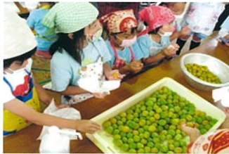
梅を拭いている様子