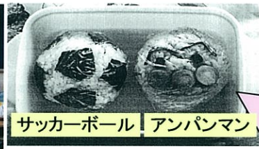
サッカーボール | アンパンマン