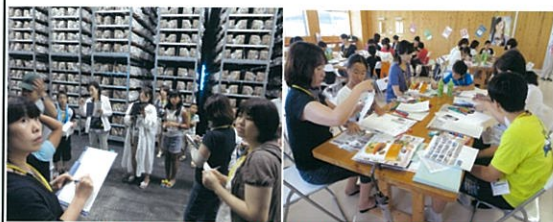
しいたけ工場見学とレポート作成の様子

県では、食品の安全・安心に関するリスクコミュニケーションを県内各地で年に9回ほど開催しており、農林水産物や製造加工、学校給食、食品表示など様々なテーマを取り上げてディスカッションしています。これまで『みんなで考えよう！国産食品と輸入食品のリスク』、南島原市での『夏休み親子で行くしいたけ工場見学』などを開催しました。今後の開催案内や、これまでの実施結果は課のホームページに掲載していますのでご覧ください。