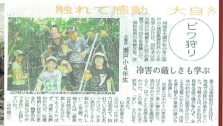
新聞に掲載されました!