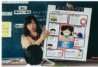
『かむことの大切さ』を学ぶ様子