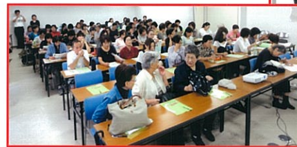
沢山の方の参加がありました