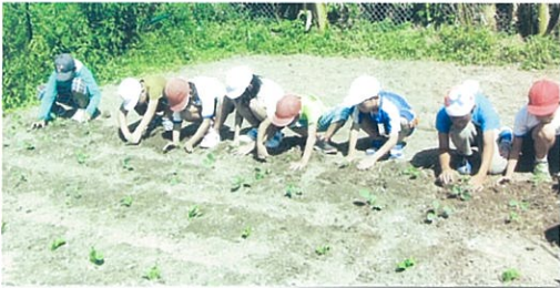
多以良小学校3・4年生