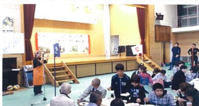
↑ 3世代ふれあい祭り →