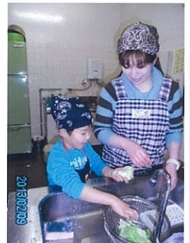
親子クッキングの様子