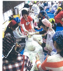
手作りみそコーナー