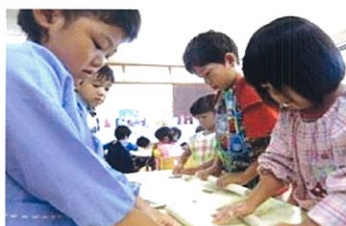
年少・年中児は生地をのぼす