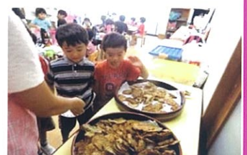
おかわりください！