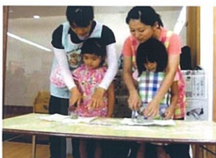
年長児は交代で生地を切る