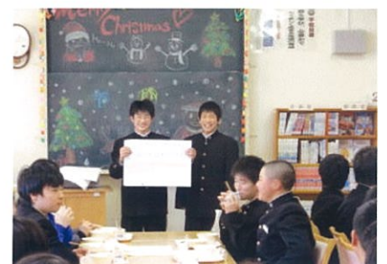
交流給食でクイズを出題

学期に1回、縦割りで食事会を実施している。BGMを流し、食に関するクイズをしたりして楽しい交流給食になっている。