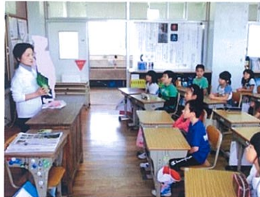
伝統野菜について説明

内容：『雲仙こぶ高菜』を鶴田小学校園へ定植 月日：平成25年10月17日 対象：3年生20名 作業：○1週間の水やり ○虫採り ○3月に3年生と父兄で収穫体験、調理を通して食の安全を学ぶ