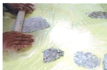
薄～くのぼしました