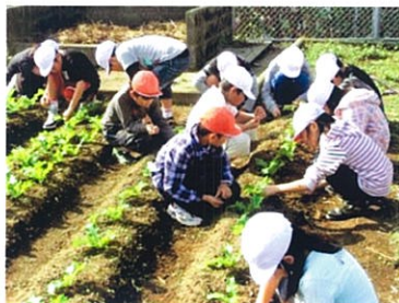
植え付け・水やりの様子