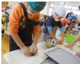
クッキー型抜き中

クッキー生地感触を楽しみながら、星やハート、うさぎなどいろいろな型に抜きました。お昼からは、手作りのメッセージをつけて袋詰めをしました。クッキーを渡すときには、大きな声で感謝の気持ちを述べることができました。