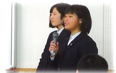
諫早農業高校のみなさん

6人の高校生による活動報告でした。その内容はもちろんのこと、口調やスライドのまとめ方など、発表の技術はとても素晴らしかったです。