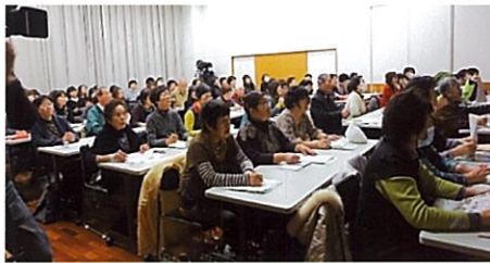
沢山の方に参加していただきました

さまざまな食育の取組事例をとおして、“食”の持つ役割と大切さを学び、これからの“食”との関わりを考える機会となるよう開催しました。当日は、多くの県民の皆様にご出席いただきました。ありがとうございます。