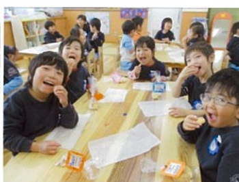
お楽しみ味見タイム