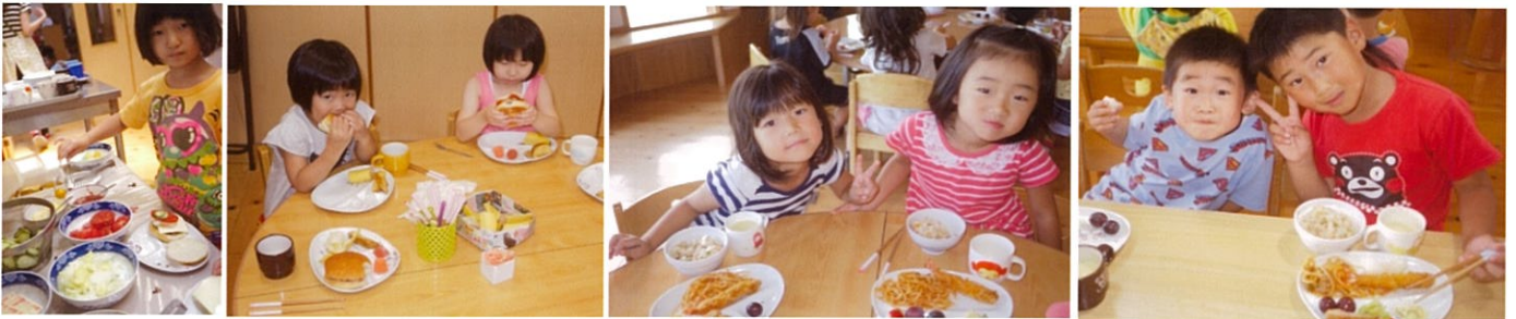
佐世保バーガー(7月「食育の日」)