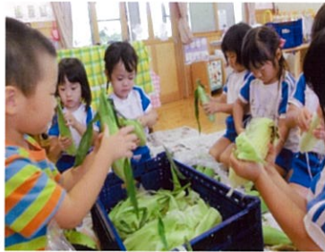
とうもろこしの皮むき

○ 10月3日、0歳児19名の保護者の方に参加していただきました。親子体操やふれあい遊び、わらべうた、ベビーマッサージ等の体験後に親子で給食試食会を行いました。