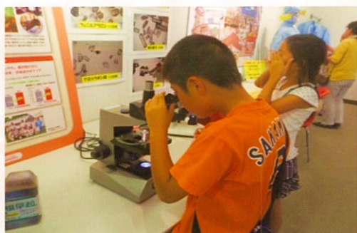
夏休み親子食品安全教室での様子

どんな食品にもリスクがある（摂取量によっては体に悪影響を及ぼす可能性がある＝ゼロリスクはない）ということ为前提に、リスクに関係する人々（消費者、食品関連事業者、行政等）の間で、食品のリスクに関する情報や意見を相互に交換すること、これをリスクコミュニケーションといいます。