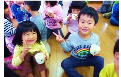
『あごだし』おいしい！