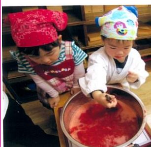
いちごジャム作り