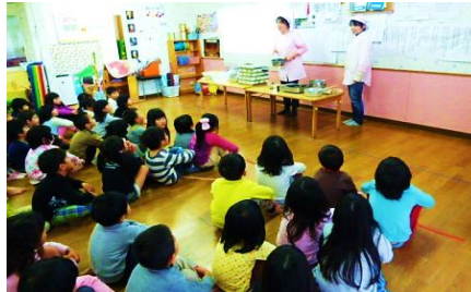
みんな、真剣な表情で見っていました