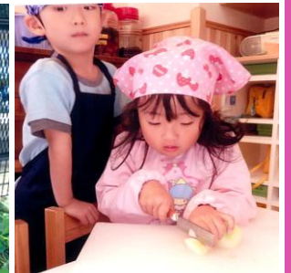
玉ねぎ切りに挑戦