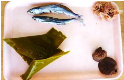
こんぶ、かつお、しいたけ、あご 1番人気は「あごだし」でした

11月24日の「良い日本食の日」、3・4・5歳児にダシの『うまみ』を伝えました。子どもたちの前で、あごだし・かつお節・昆布・しいたけのダシをとり、試飲しました。「さかなの味がする」「おいしい」と言っていました。お迎えに来た保護者にも試飲して頂くと、「家でも、だしをとってからの料理をしてみます。」と、関心を持って頂きました。11月24日の『良い日本食』の日だけでなく毎日、和食の『うまみ』を伝えていきたいと思います。