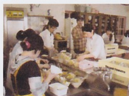
お菓子屋さんも参加して ケーキのプレゼント