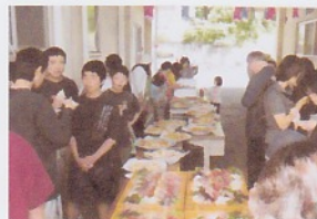
子ども達やご父兄の食事風景