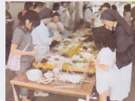
長崎の魚が一番人気！