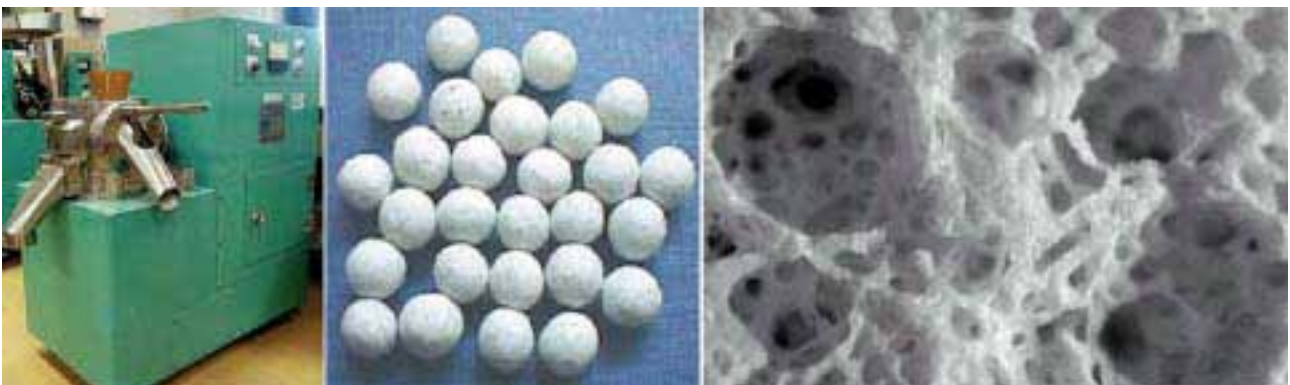
当センター保有の球形整粒機（左） 機能性素材加工品（球形）（中） 加工品の内部組織（多孔体）（右）