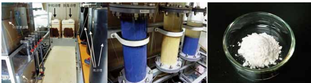
リン吸脱着システム