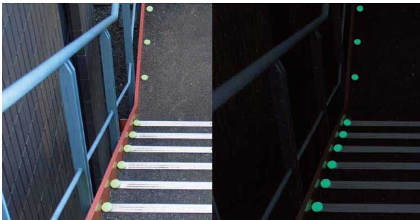
エコほたるを設置した階段の昼（写真左）と夜（同右）