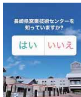
■ (上) ハッシュタグの事例 (下) アンケートの事例