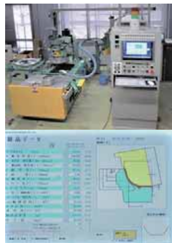
■(上) 装置外観 (下) 成形データ画面