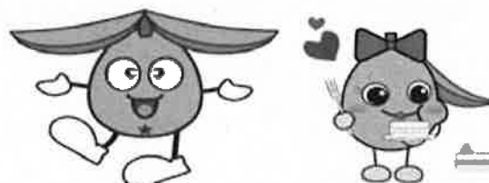
びわ太郎くん こびわちゃん 長崎県食育及び食の安全・安心イメージキャラクター