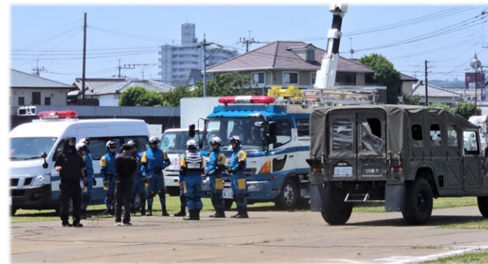
本明川の河川敷で行われた演習状況