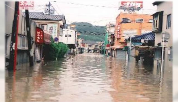
浸水する川棚駅前商店街 (平成2年7月)

「歩くことや移動が大変だと感じている方」や「お子さんという方」、「その支援をする方」等の避難に時間がかかる方は、特に、 早めの行動が、あなたや周りの方の命を守ることに繋がります。