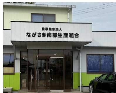
ながさき南部生産組合