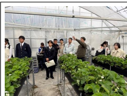
深山農園(イチゴハウス)