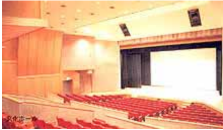
香焼公民館 文化ホール