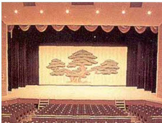
三和公民館 ホール