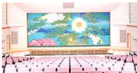
琴海文化センター ホール