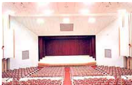
コミュニティーセンターホール(5F)