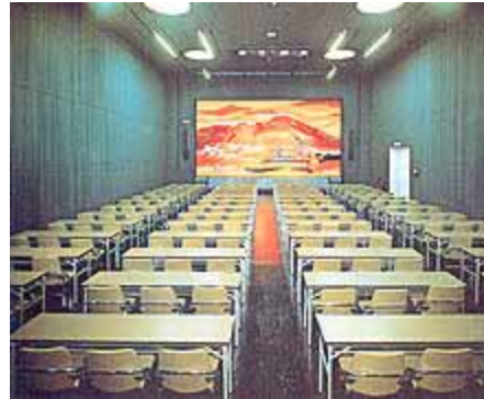
島原文化会館 中ホール