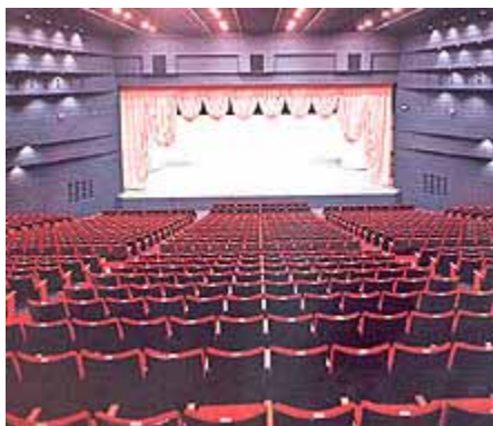
島原文化会館 大ホール