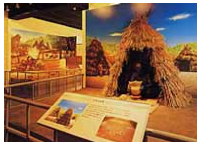
大野原遺跡展示館「縄文の里」