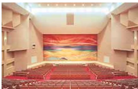
大ホール(サニーホール)

演奏会や演劇など多彩なニーズに対応でき、様々なイベントを通して多くの出会いができる場です。